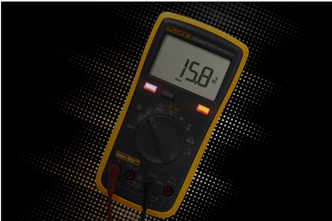
Cảnh báo bằng âm thanh và hình ảnh khi thiết lập sai giúp bảo vệ cấu chì