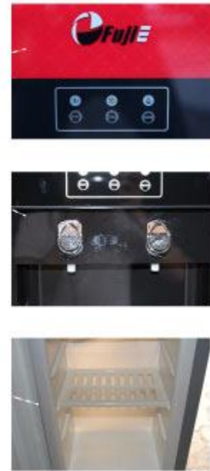
Cấu tạo các bộ phận của cây nước