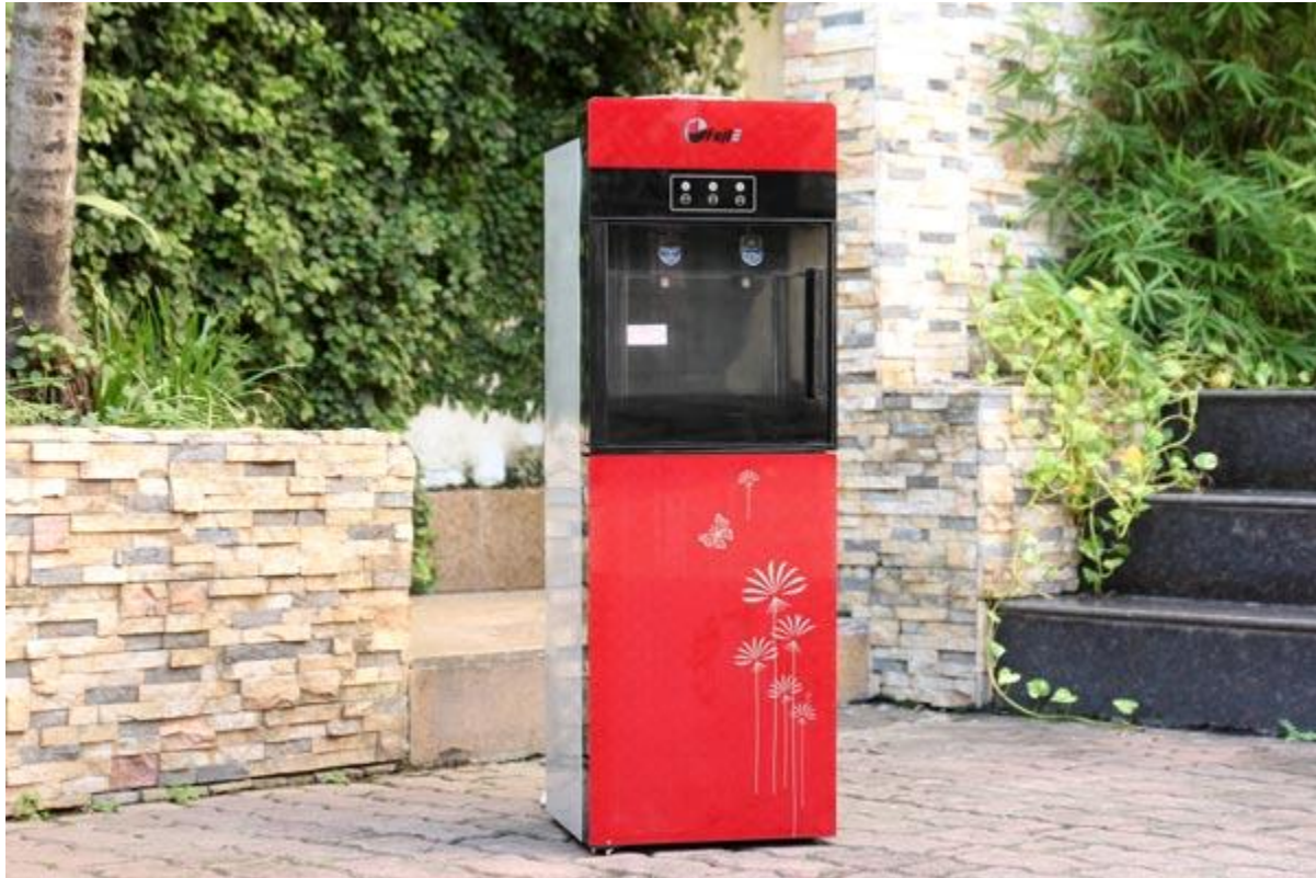
Cây nước nóng lạnh FujiE WD1500C làm lạnh Block

Cây nước nóng lạnh FujiE là hãng sản phẩm lọc nước đến từ Nhật Bản được tích hợp tính năng và được cải tiến với công nghệ tiên tiến nhất, đa dạng về mẫu mã, kiểu dáng sang trọng luôn được người tiêu dùng Việt Nam ưa chuộng và tin dùng. Dòng cây nước nóng lạnh WD1500C của FujiE với công nghệ làm nóng và lạnh nhanh bằng block , thiết kế hiện đại đột phá với ngăn chống bụi bảo vệ vòi nước và tay cầm như tủ lạnh chắc chắn sẽ là sự lựa chọn phù hợp với các không gian như văn phòng, công ty hay gia đình.