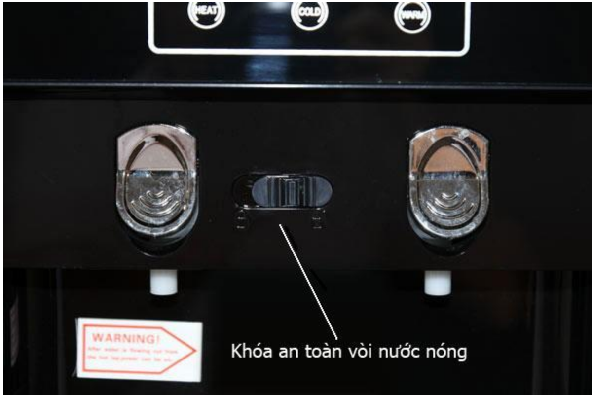
Khóa an toàn