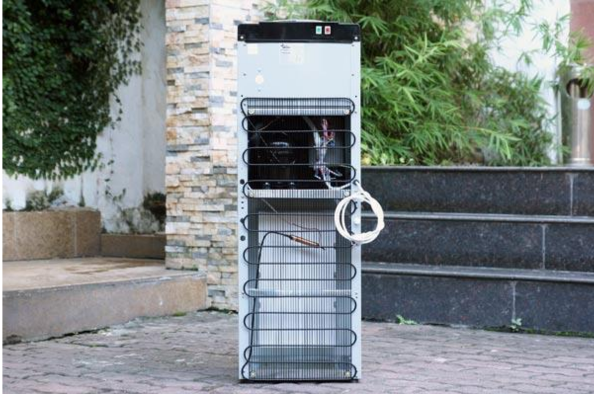
Máy có hệ thống tự động ngắt điện khi đã đun đủ nước